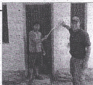
In poche ore i muri sono tornati puliti