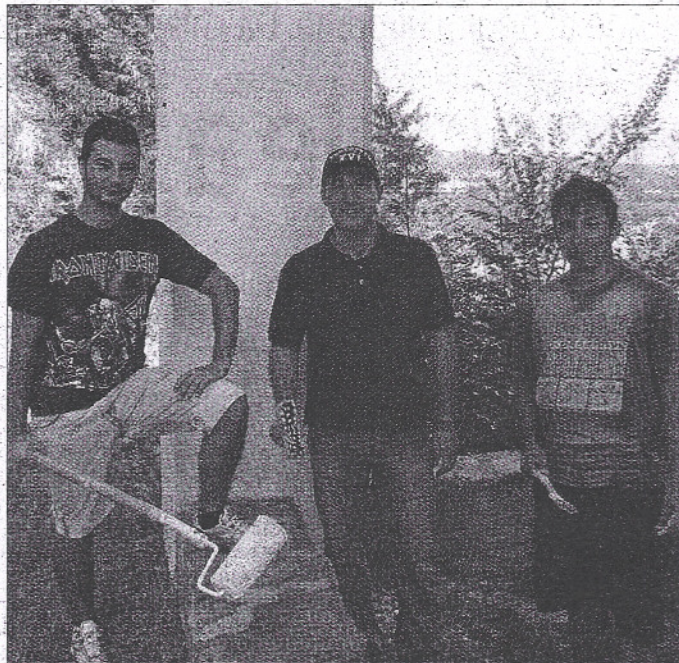
Gli studenti, allievi elettricisti, al lavoro

Così, nelle prime settimane dell'estate, verso la fine dell'anno scolastico, quando gli alunni della sezione «elettricisti» dell'Albert si sono trovati davanti alla facciata della chiesetta di San Giacinto, ci sono rimasti male. O quantomeno sono rimasti perplessi nel vedere che sul muro c'erano scritti insulti, frasi sconce, messaggi al limite della volgarità. Probabilmente lasciati sul muro da atri giovani che non si sono preoccupati di insudiciare facciata e colonne trasformando la superficie in un murale vergognoso.