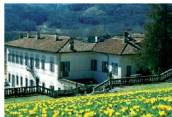
Villa Della Porta Bozzolo, la dimora incantata. Casalzuigno (VA)