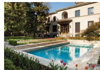
Villa Necchi Campiglio, l'arte è di casa. Milano