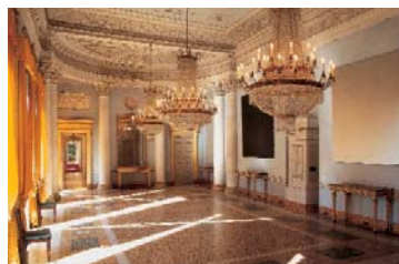
Villa e Collezione Panza, l'arte senza tempo. Varese