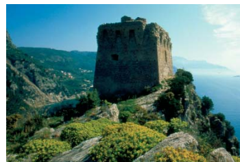
Baia di Ieranto, l'incanto delle sirene. Massa Lubrense (NA)