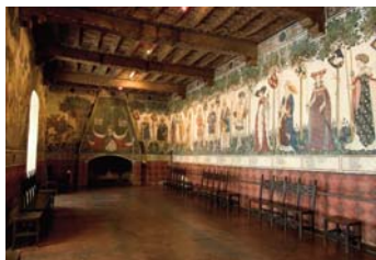
Manta, il castello degli eroi. Manta (CN)