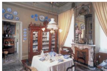
Casa Carbone, dove rivive il fin-de-siècle. Lavagna (GE)