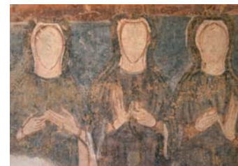
Torba, un monastero e mille anime. Gornate Olona (VA)