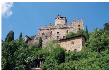
Castello di Avio, la sentinella del Trentino. Sabbionara d'Avio (TN)