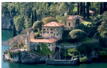
Villa del Balbianello, un lago di bellezza. Lenno (CO)