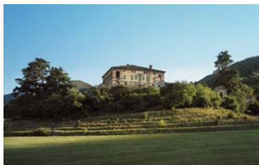
Villa dei Vescovi, gioiello dei Colli Euganei. Luvignano (PD) (Apertura prevista: primavera 2011)