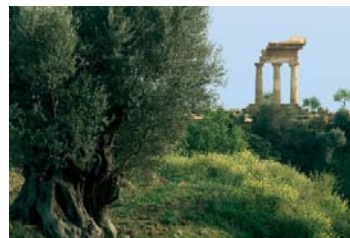
Kolymbetra, giardino di delizie. Valle dei Templi (AG)

Per questo ti chiediamo di adottare il tuo Bene FAI del cuore. Bastano 15 euro al mese.