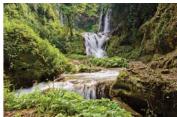
Parco Villa Gregoriana, una cascata di meraviglie. Tivoli (RM)