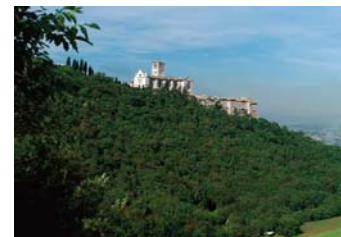
Bosco di San Francesco, qui il paesaggio è sacro. Assisi (PG) (Apertura prevista: primavera 2011)