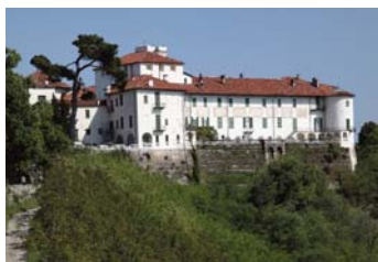
Castello di Masino, il grande re della pianura. Caravino (TO)