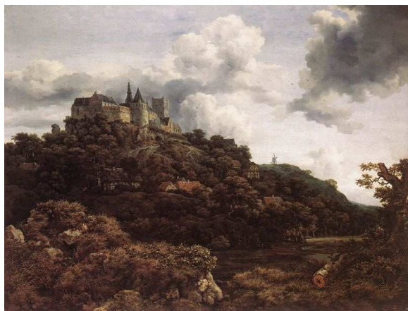
Jacob Van Ruysdael

L'importanza del paesaggio è evidente nello sfumato leonardesco , tecnica pittorica attraverso la quale Leonardo da Vinci rappresentava quasi scientificamente persino l'aria che si interpone tra le figure in primo piano e gli sfondi.